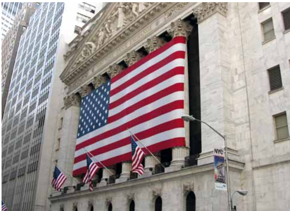
La bourse de Wall Street à New York

Des « Printemps Arabes » aux violentes révoltes londoniennes en passant par les « indignés » de Madrid ou d'Athènes, n'est-ce pas l'exaspération que génèrent ces dérèglements qui se manifeste ? Car, en définitive, comment ne pas avoir le sentiment que ce sont toujours les plus pauvres et les plus démunis qui « paieront l'addition » ? Que penser quand on voit – même s'il fallait le faire – que l'on a été beaucoup plus prompts à lever des fonds pour sauver les banques que pour sauver la vie des habitants de la corne de l'Afrique ?