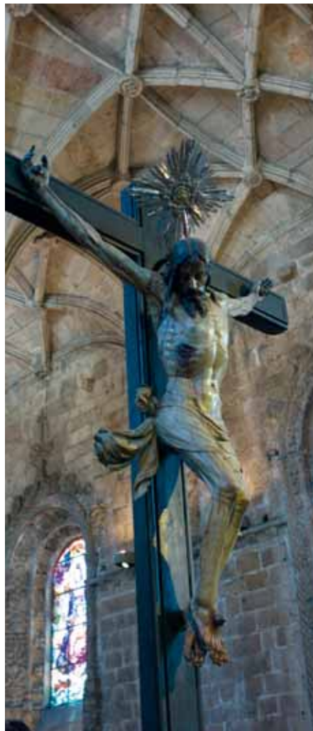
Christ en croix, couvent des Hiéronymites, Lisbonne

situer toute chose dans la perspective de l'histoire du salut, mais encore d'apprécier plus justement la réalité du monde actuel. Et cela, non en l'étu-